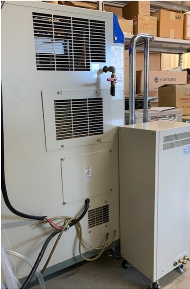
【窒素発生装置とエアコンプレッサー比較】