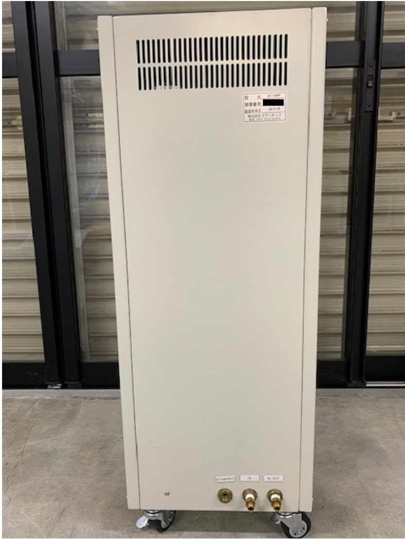
【窒素発生装置本体背面】