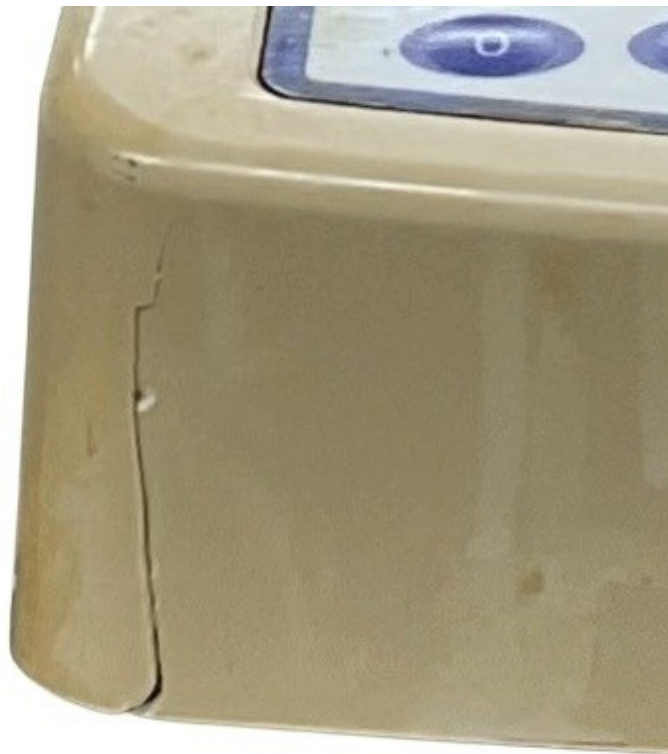
【本体ひび割れ部拡大】