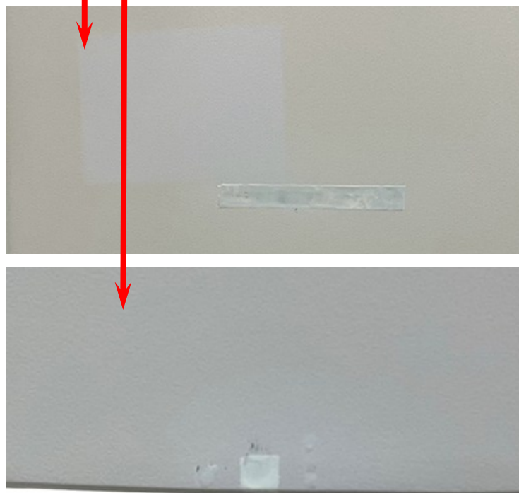
【微小塗装剥げ部(ニヶ所)】