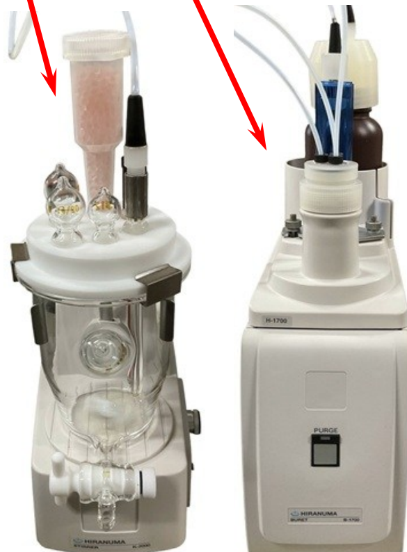
【反応ユニット+送液ユニット】