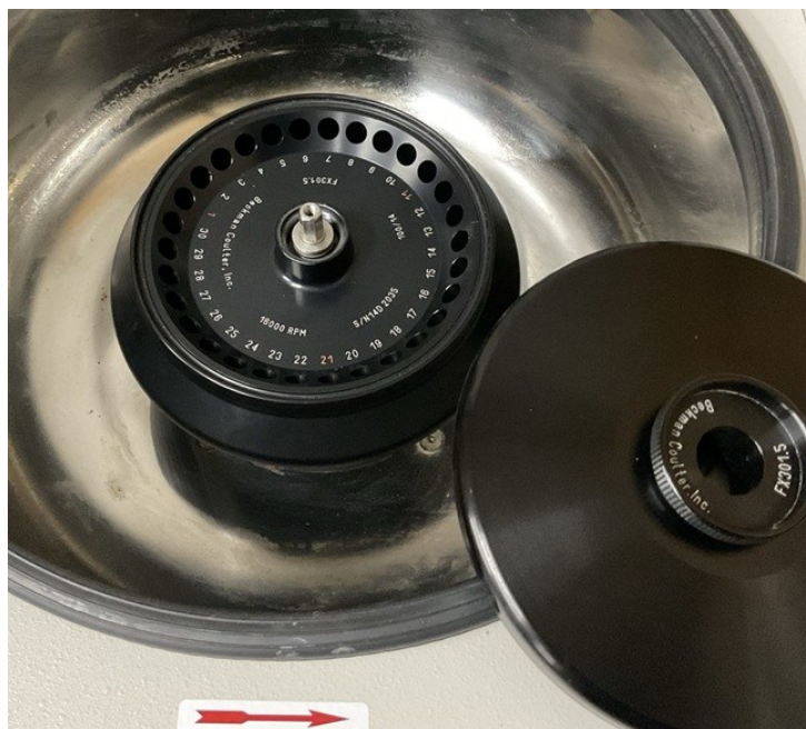
【ロター-1 = FX301.5(16,000rpm) 】