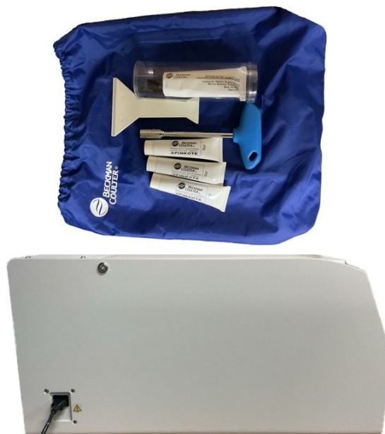
【メンテナンスキットと装置側面】