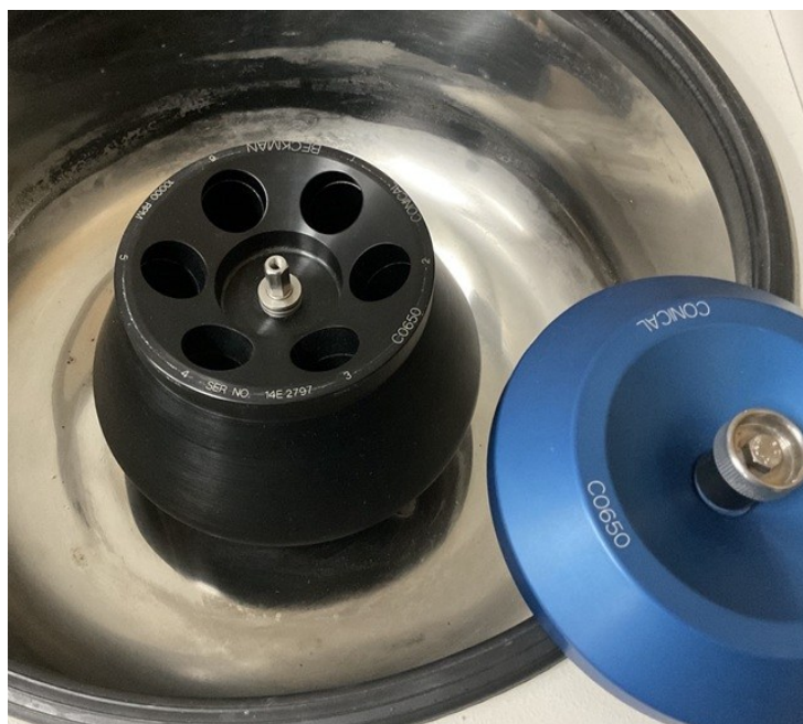
【ロター-2 = CO650(10,000rpm) 】